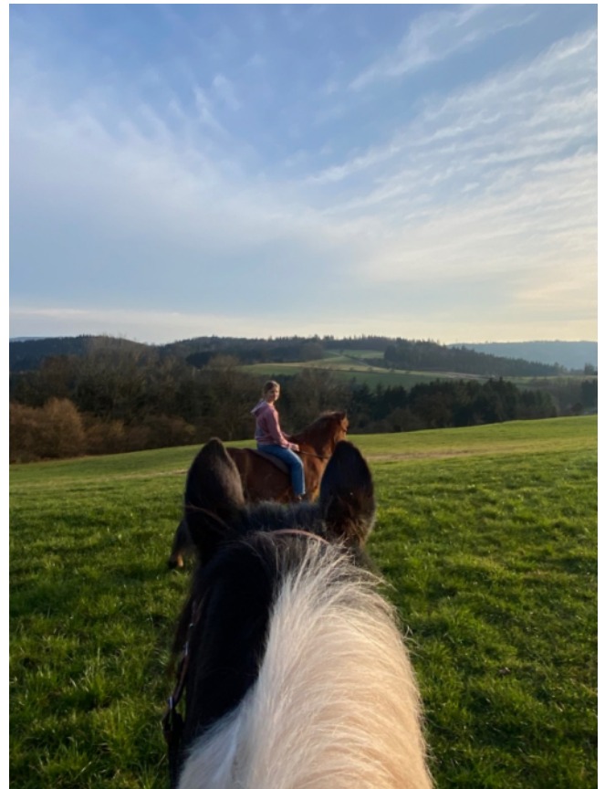
Zurück in Großhöchberg, meine liebe Schwester Selma :-)