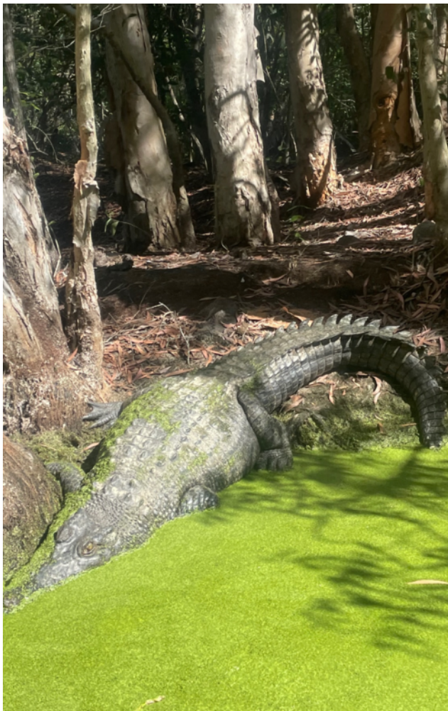
Hartley's Crocodile Adventures