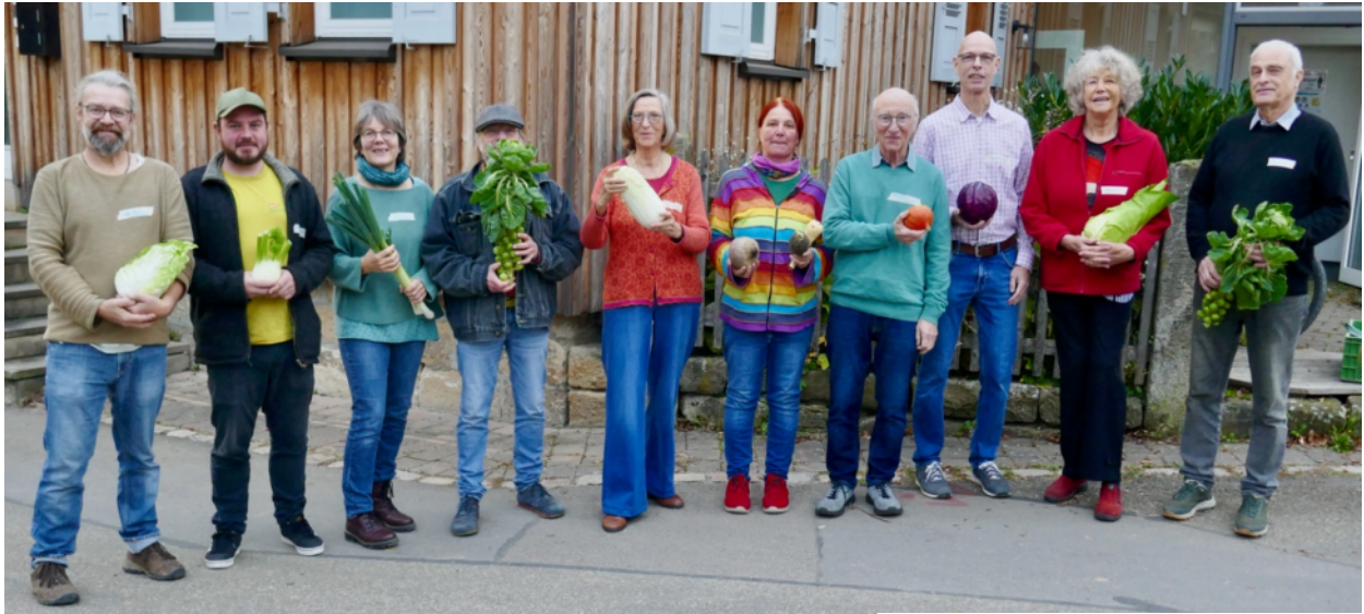
Gründungsmitglieder s. Blick in die Woche KW 3

Die 1. Mitgliederversammlung fand am 31.01.2026 statt.