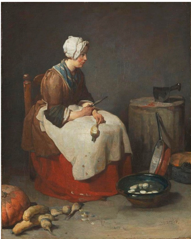
Die Rübenputzerin, Jean Siméon Chardin, um 1738

Möhren und Pastinaken sind miteinander verwandt. Die Rote Bete ist der Einzelgänger unter den Rüben. Und alle Rüben, die ihr diese Woche in der Verteilung habt, gehören zur selben Familie: die der Kreuzblütler. Da ist es nicht verwunderlich, dass sie alle ein bisschen was von Kohl oder Rettich in sich tragen. Da wird mir wieder klar, dass wir hier in der Kohlregion schlechthin leben. Bevor Kartoffeln und sonstige Leckereien aus fernen Ländern zu uns gebracht wurden, haben die Kelten, Germanen und sonstige hier lebenden Völker kaum was anderes als Kohl und Getreide kultiviert. Der wächst hier gut und damit lässt sich auch in strengen Wintern überleben. Erst in jüngster Geschichte, nämlich während des Ersten Weltkriegs, hat die Steckrübe im Winter 1916/17 vielen Menschen das Leben gerettet. Nach einer misslungenen Kartoffelernte im Herbst wurden viele Steckrüben, die damals eigentlich für die Schweine angebaut wurden, dann eben stattdessen von den Menschen gegessen. Praktisch alle Lebensmittel waren zu der Zeit in Deutschland knapp, sodass es fast zu jeder Mahlzeit Steckrüben gab. 1917 erschien ein Steckrüben-Kochbuch sogar mit einem Rezept für Steckrüben-Kaffee: „Steckrüben raspeln und im Ofen trocknen. Die getrockneten Rübenschnitzel werden dann